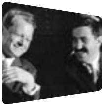
Beteiligung an Wahlkampftourneen für Willy Brandt

literarische, politische und ganz persönliche Äußerungen von Grass dokumentiert. Die Audio- und Videodokumente seit den 50er und 60er Jahren geben ein Stück Zeitgeschichte wieder und vermitteln einen lebendigen Eindruck von der Entwicklung der Bundesrepublik Deutschland – weit über die Person Günter Grass hinaus.