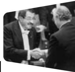
Günter Grass wird in Stockholm mit dem Literatur-Nobelpreis geehrt