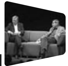
Günter Grass auf dem Blauen Sofa im Berliner Ensemble