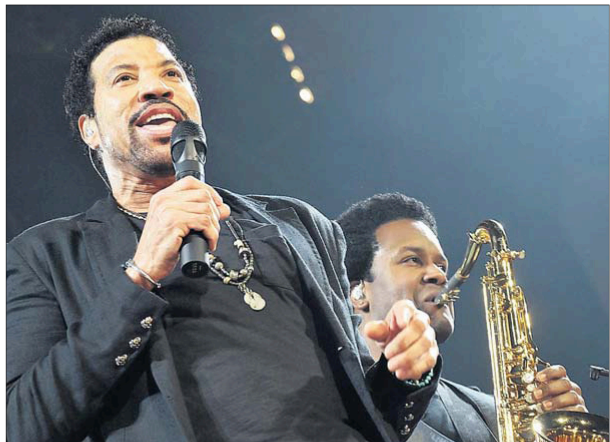
Mit seinen über jeden Zweifel erhabenen Live-Qualitäten sorgte Lionel Richie für einen locker-leichten Abend im Bremer AWD-Dome.

Akustisch-optischer Höhepunkt ist der Funk-Klassiker „Brick House“, zu dem schrill-bunte Muster im 70er-Jahre-Stil über die Leinwände flimmern. Das Highlight ist „Dancing on the Ceiling“ – da gibt es im AWD-Dome kein Halten mehr. Dagegen fällt die Zugabe „All Night Long“, der Song, auf den irgendwie alle so lange gewartet haben, fast schon ab.